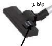
Szőnyeg / kemény padló felületkapcsoló