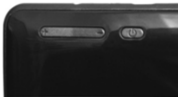
Hangerő fel/le gomb Ki/be gomb