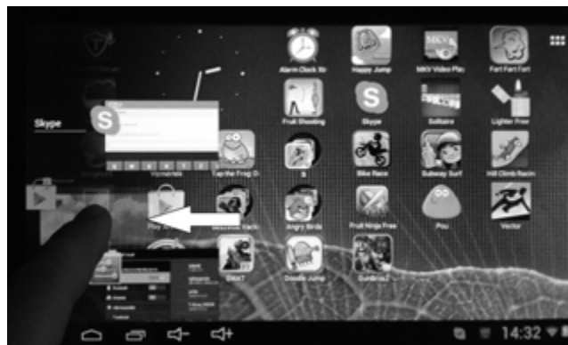
Futó alkalmazásból történő kilépés

Futó alkalmazások listázása gomb (3) meg nyomását követően megjelennek az éppen futó alkalmazások. Az alkalmazásokra koppintva közvetlenül beléphet az alkalmazásokba. Ha be akar zárni egy alkalmazást, akkor annak kis méretű ablakát húzza balra nyomva tartva addig, míg el nem tűnik.