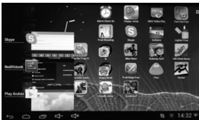
Éppen futó alkalmazások kis ablakban