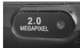
Hátsó kamera nyílás