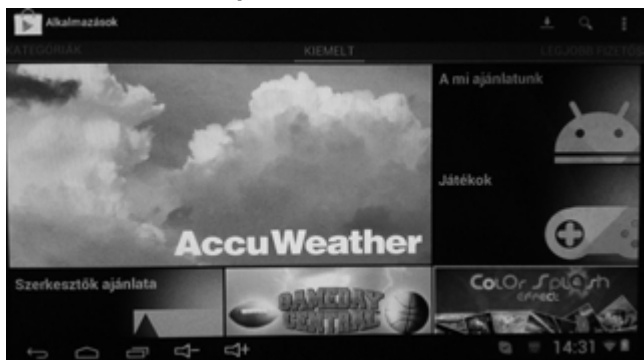
Play áruház induló képernyő

Alkalmazásokat a Play Áruházból tölthet le a készülékre. Az áruház már telepítve van a készüléken. Használatához mindössze egy Google felhasználói fiókra (pl. gmail) van szüksége. Az áruházba történő első belépéskor kérni fogja a Google fiókjának felhasználó nevét és jelszavát. Ezt követően a rendszer már automatikusan csatlakozik az áruházhoz és az alkalmazások frissítéseit is automatikusan fogja letölteni. Az áruházban többszáz ezer alkalmazás van, melynek egy része ingyenes, egy része térítés ellenében tölthető le.