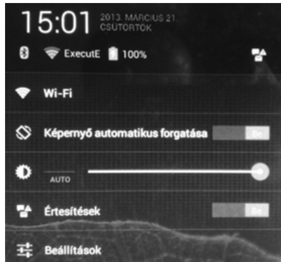
Jobb alsó sarokban felugró menü

Beállítás menü elérése: koppintson a jobb alsó értesítési sávra, majd a felső sávra, ezt követően pedig a Beállítás menüpontra. A készülék összes paramétere, jelszavak beállítások innen érhetőek el.