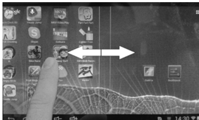
Váltás az asztalok közt

A programok az asztalon találhatóak, egy koppintással lehetséges az indításuk. Ha át szeretné helyezni az ikont, akkor tartsa nyomva majd nyomva tartva húzza a kívánt helyre. Akár a jobbra/balra található asztalokra is áthelyezheti. A programok még elérhetők a jobb felső sarokban található kis négyzetekkel jelölt ikonra koppintva is. Ekkor az összes alkalmazás ikonja láthatóvá válik.