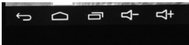
Bal alsó sarokban látható funkció gombok

Az asztal jobbra is és balra is megtalálható. A képernyőt nyomva tartva és oldalirányba elhúzva válthat az asztalok között.